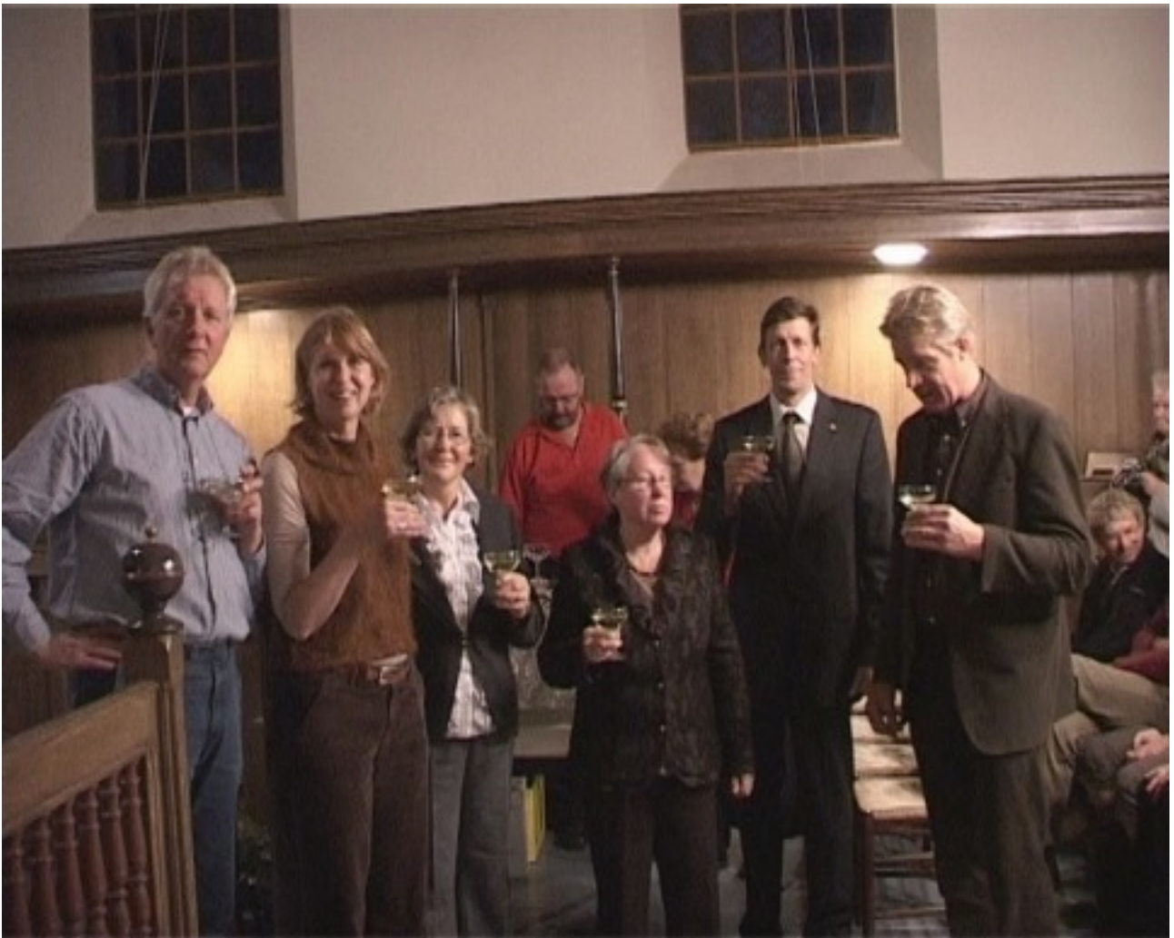
Na de opening wordt er getoost waarna vervolgens gelegenheid is de expositie te bekijken.