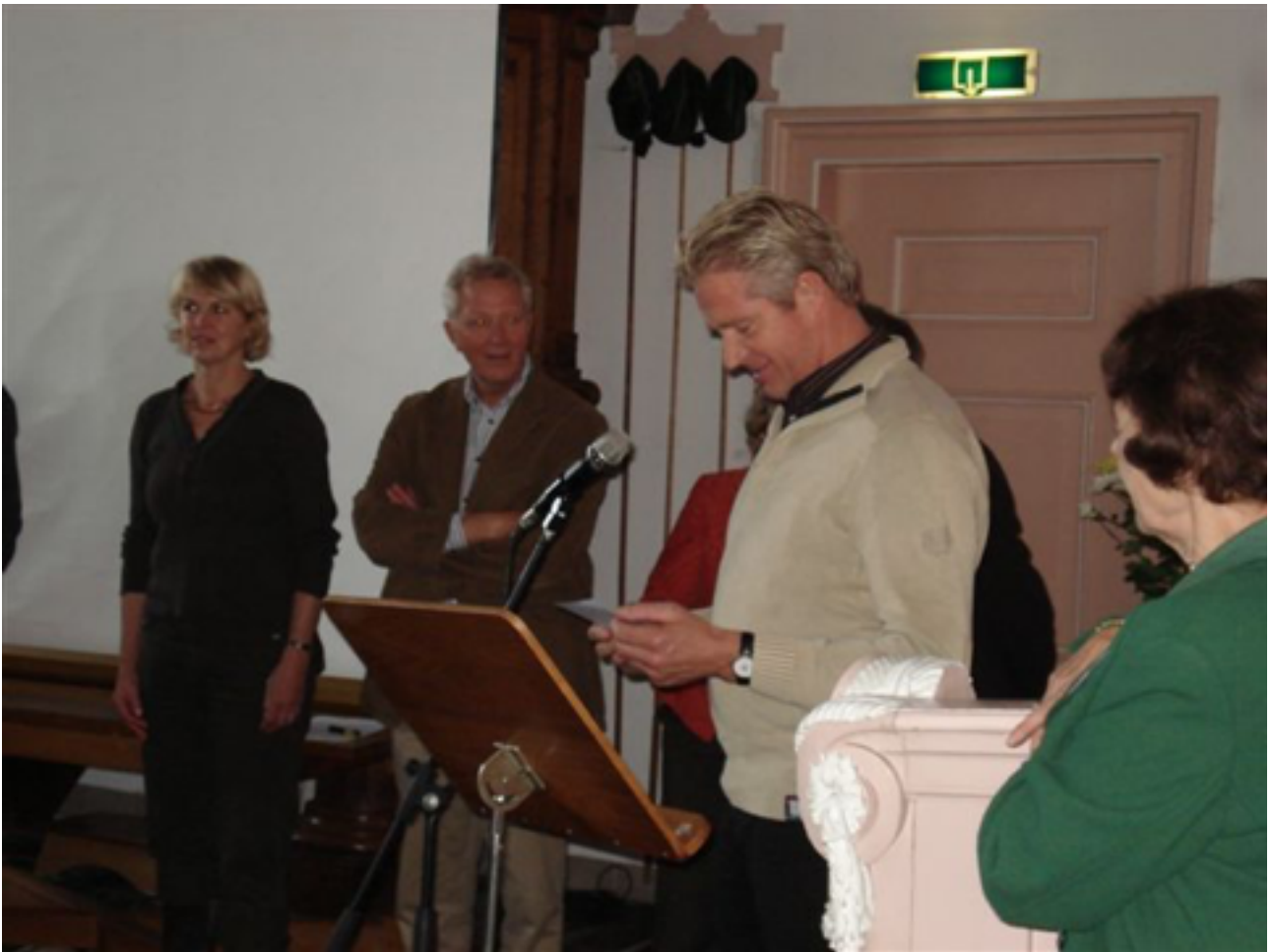
Uitreiking van de aanmoedigingsprijs in Leimuiden